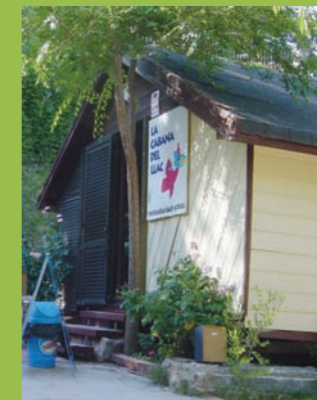
La Cabana del Llac, un lloc per prendre alguna cosa